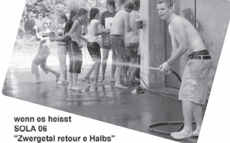
wenn es heisst SOLA 06 "Zwergetal retour e Halbs"