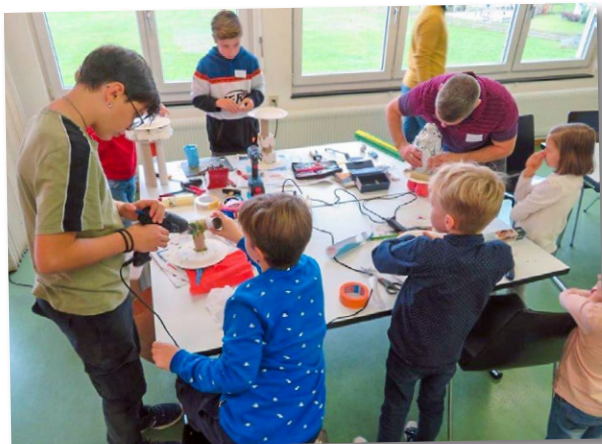
Kirche Kunterbunt, 13. November 2022