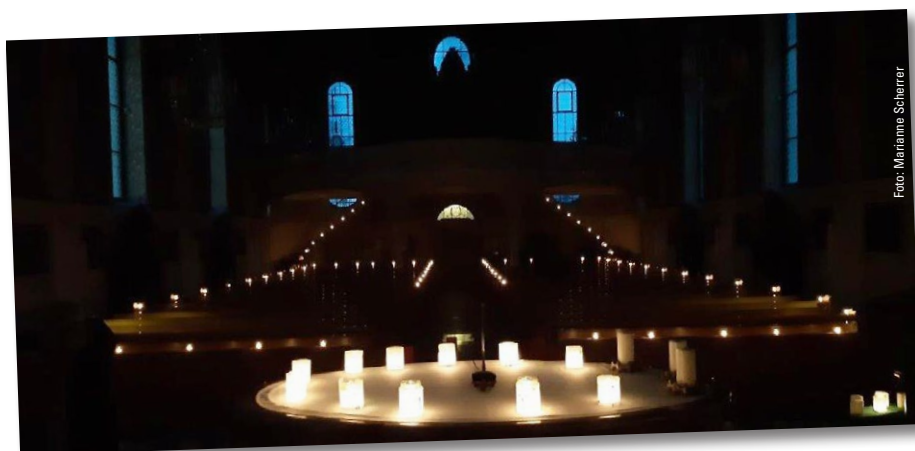
Rorate, 2. Dezember 2022