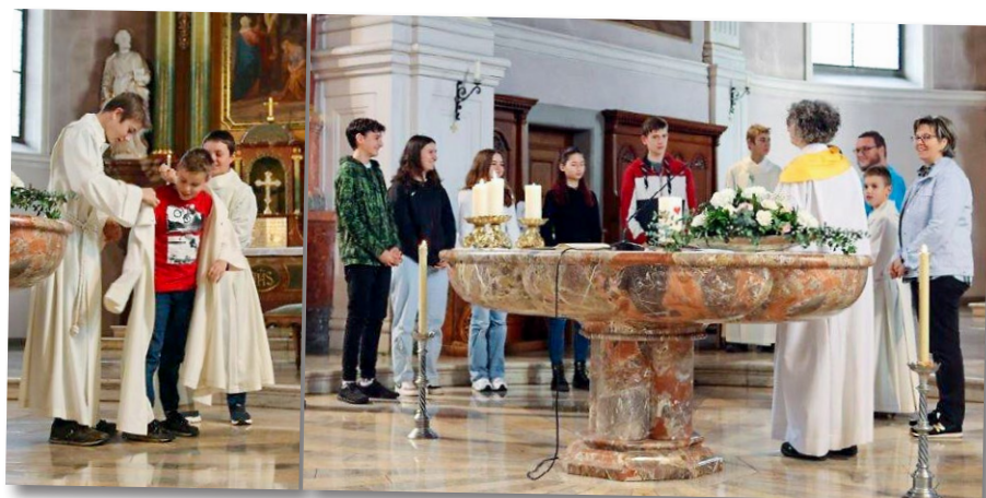
Ministranten-Aufnahme und -Verabschiedung, 20. November 2022