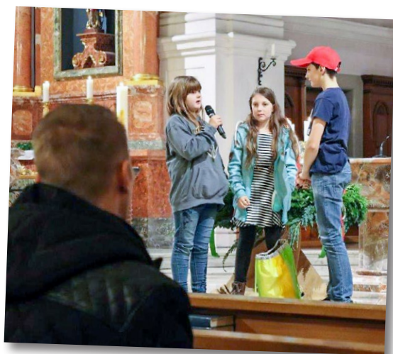
Familiengottesdienst, 26. November 2022